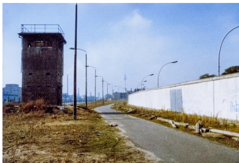
© Ralf Roletschek / wikipedia GNU Free Document License, Version 1.2

Το καλοκαίρι του 1945 ο Β΄ Παγκόσμιος Πόλεμος ( Zweiter Weltkrieg ) έχει τελειώσει. Η Γερμανία εξαρτάται πλέον από τις διαθέσεις των τεσσάρων μεγάλων νικητριών δυνάμεων, Η.Π.Α., Μ. Βρετανίας, Γαλλίας και Σοβιετικής Ένωσης (Sowjetunion) , οι οποίες με το σκεπτικό να μην ξεκινήσει ποτέ ξανά πόλεμος από γερμανικό έδαφος, αποφασίζουν να τη χωρίσουν σε τέσσερις ζώνες κατοχής (Besatzungszonen) . Η κάθε δύναμη διοικεί και έναν τομέα. Διαιρείται επίσης και η μέχρι τότε πρωτεύουσα, το Βερολίνο (Berlin) , σε τέσσερις τομείς (Zonen) .